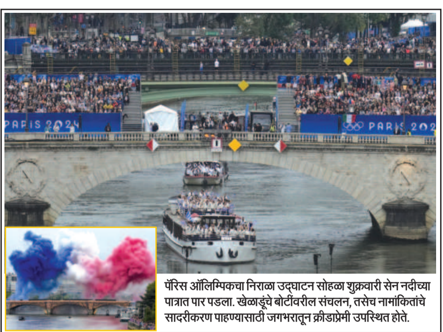
पॅरिस ऑलिम्पिकचा निराळा उदघाटन सोहळा शुक्रवारी सेन नदीच्या पात्रात पार पडला. खेळाडूंचे बोटीवरील संचलन, तसेच नामांकितांचे सादरीकरण पाहण्यासाठी जगभरातून क्रीडाप्रेमी उपस्थित होते.

दम्बुला : रेणूका सिंह ठाकूर (१० धावांत ३ बळी) आणि डावखुरी फिरकी गोलंदाज राधा यादव (१४ धावांत ३ बळी) यांच्या प्रभावी मात्यांतर सलामीची फलंदाज स्मृती मनधानाने (३९ चेंडूंत नाबाद ५५ धावा) साकारलेल्या अर्धशतकाच्या जोरावर भारतीय महिला संघाने शुक्रवारी बांगलादेशचा १० गडी आणि ५४ चेंडू राखून धुव्वा उडवत आशिया चषक ट्वेन्टी-२० क्रिकेट स्पर्धेच्या अंतिम फेरीत घडक मारली. उपांत्य फेरीत प्रथम फलंदाजी करणाऱ्या बांगलादेशला २० षटकांत ८ बाद ८० धावाच करता आल्या. यानंतर भारताने ११ षटकांतच बिनबाद ८३ धावा करत विजय साकारला. मनधानाने आक्रमक शैलीत फलंदाजी करताना बांगलादेशच्या गोलंदाजांना दडपणाखाली ठेवले. तिने आपल्या खेळीत ९ चौकार आणि एक षटकार लागावला. तिला शफाली वर्मानी (नाबाद २६) चांगली साथ दिली. अंतिम फेरीत भारतासमोर यजमान श्रीलंकेचे आव्हान असेल. दुसऱ्या उपांत्य सामन्यात श्रीलंकेने पाकिस्तानवर तीन गडी राखून मात केली.